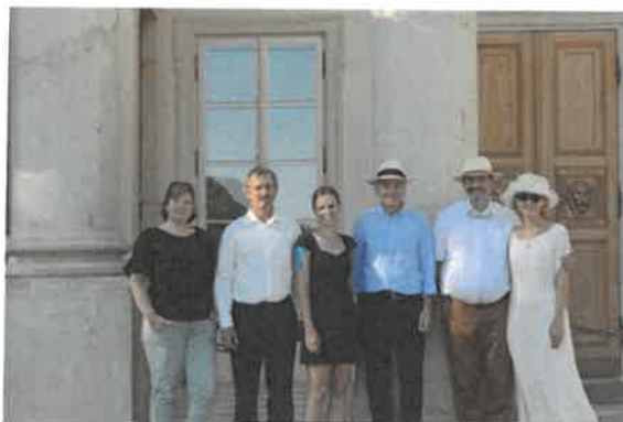
Rozloučení s polskými přáteli.